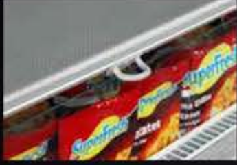
Gece Perdesi Night Blind