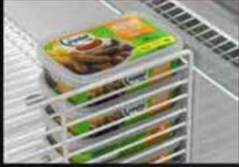
Tel Ara Bölücü Wire Product Divider