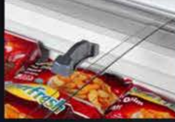
Cam Sürgü Glass Sliding Cover