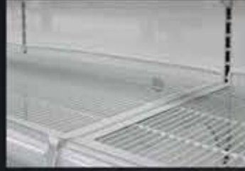
Tel Raf Wire Shelf