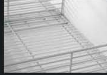
Tel Taban Wire Base